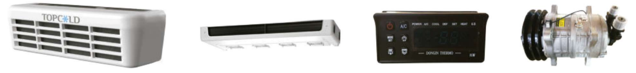
Condensador montado en la nariz Evaporador delgado de 4 ventiladores Controlador Compresor