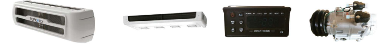
Condensador de 4 ventiladores montado en la nariz Evaporador delgado de 4 ventiladores Controlador Compresor