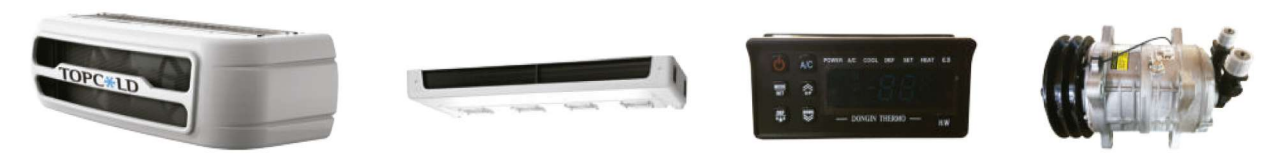
Condensador montado en la nariz Evaporador delgado de 4 ventiladores Controlador Compresor