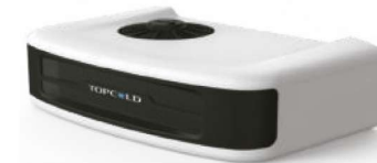
Condensador montado en la nariz/techo