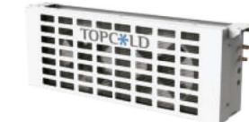
Debajo del condensador montado