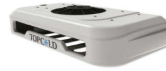
Condensador montado en la nariz